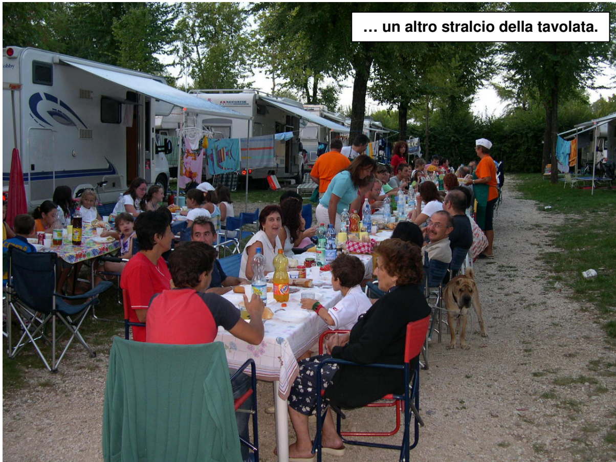
... un altro stralcio della tavolata.