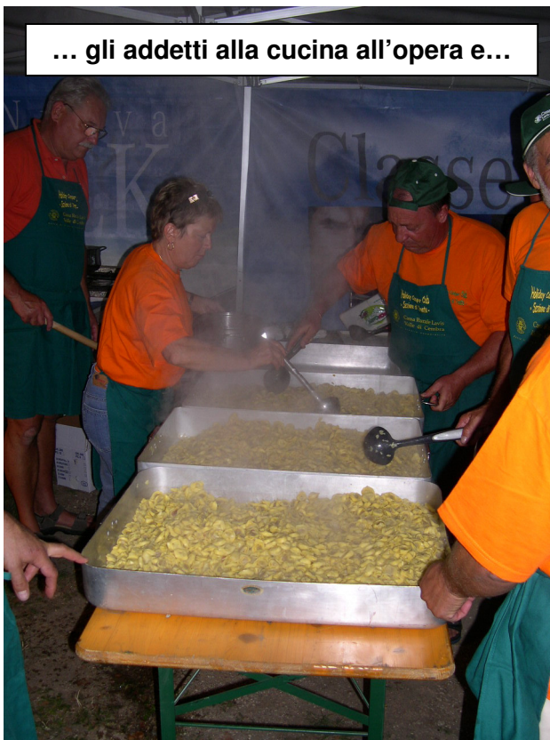
... gli addetti alla cucina all'opera e...