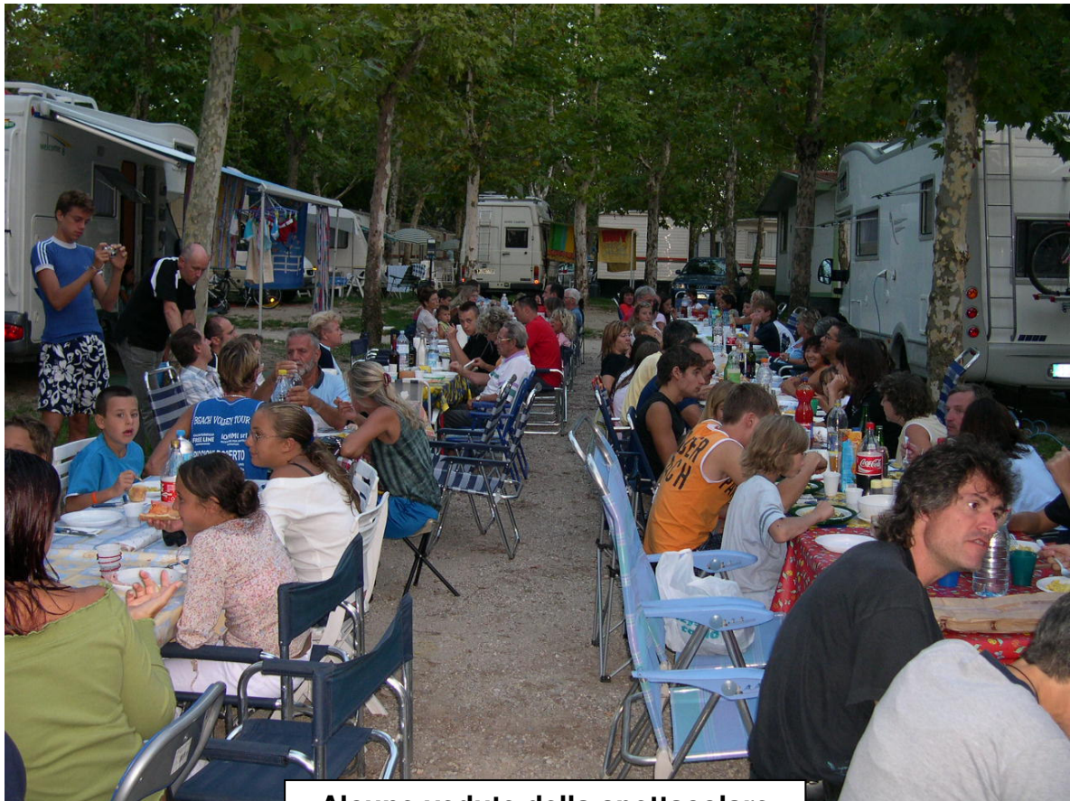
Alcune vedute della spettacolare tavolata del sabato sera.