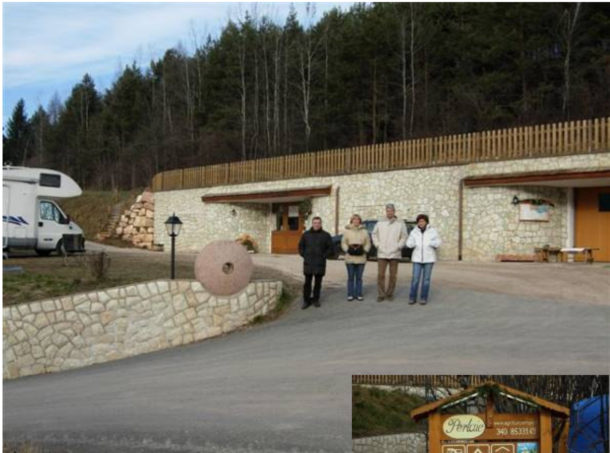
Alcune immagini dell'Agritur Perlaie di Cavalese.