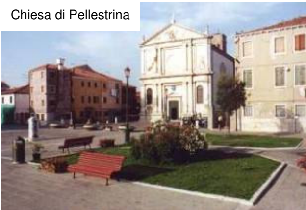
Chiesa di Pellestrina