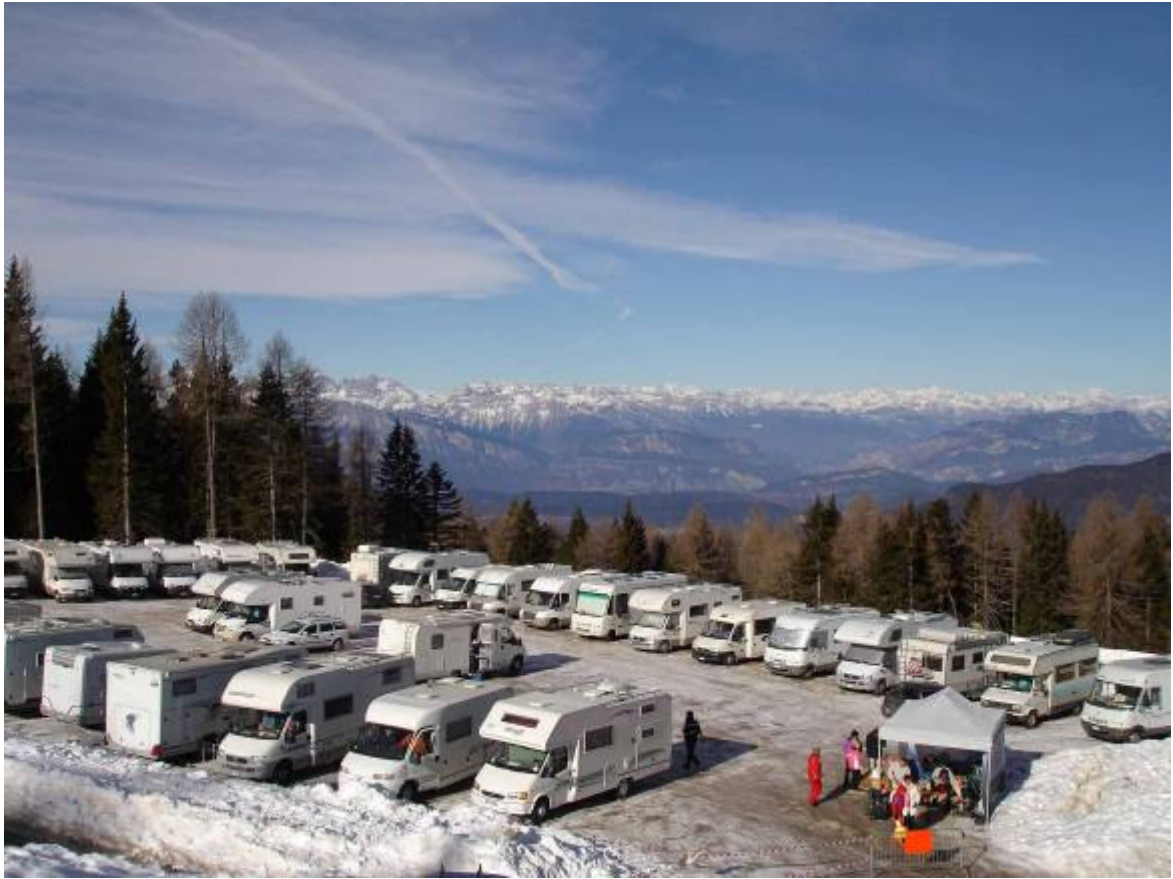
ALCUNE VEDUTE PANORAMICHE DEL PARCHEGGIO