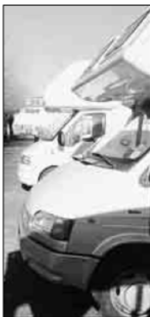
Camper in sosta