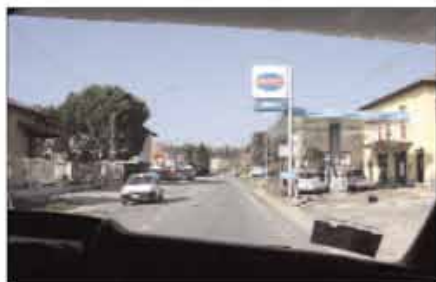
Un occhio attento alla strada e uno... alle tabelle dei prezzi applicati dalle diverse compagnie petrolifere: attenzione in particolare agli sconti periodicamente applicati dai gestori.