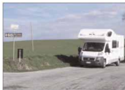
La differenza aerodinamica tra le tipologie dei motorhome, mansardati e semintegrali influisce non poco sui consumi, così come il traino e la presenza di ingombri sul profilo del tetto.

dato di categoria media, lungo circa 7 metri e con cinque persone a bordo, gravato di bagagli, biciclette e accessori classici (tendalino, portabici e via dicendo), pesa non meno di 3.500 kg. Ben più leggero un semintegrale da 6 metri con due sole persone a bordo: se non si esagera con accessori e bagagli, ci si può attestare sui 3.000 kg o poco più. Ebbene, questa differenza può davvero comportare qualche effetto benefico sui consumi.