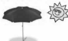
Ombrellone spiaggia gratis

13,50 € al giorno/notte (tutto compreso)