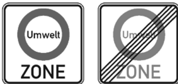
I cartelli di inizio e fine della "zona ambientale"

In molte città tedesche esistono ormai delle zone a traffico limitato in cui si può circolare solo con la così detta "Feinstaubplakette" (bollino delle polveri sottili). Di che cosa si tratta e dove si può acquistare il bollino?