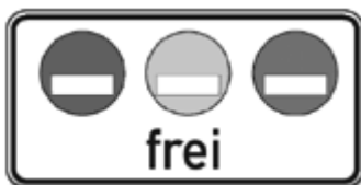
Ecco il cartello aggiuntivo a quello di sopra che vi dice con quale bollino potete circolare nella "zona ambientale"

Esistono tre bollini diversi. Infatti, sotto il cartello che segna l'inizio della "zona ambientale" si trova sempre un altro cartello aggiuntivo (vedi sopra) che vi dice con quale dei tre bollini è possibile circolare qui. Esistono tre cartelli diversi, cioè: